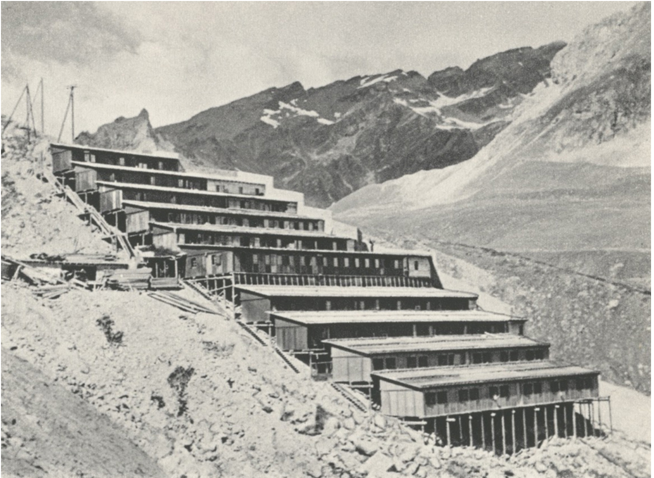
Photo à droite: Village ouvrier du P4 au – dessus d’Arolla. Les baraquements servaient de base pour creuser les tunnels d’amenée d’eau vers la Grande Dixenc.