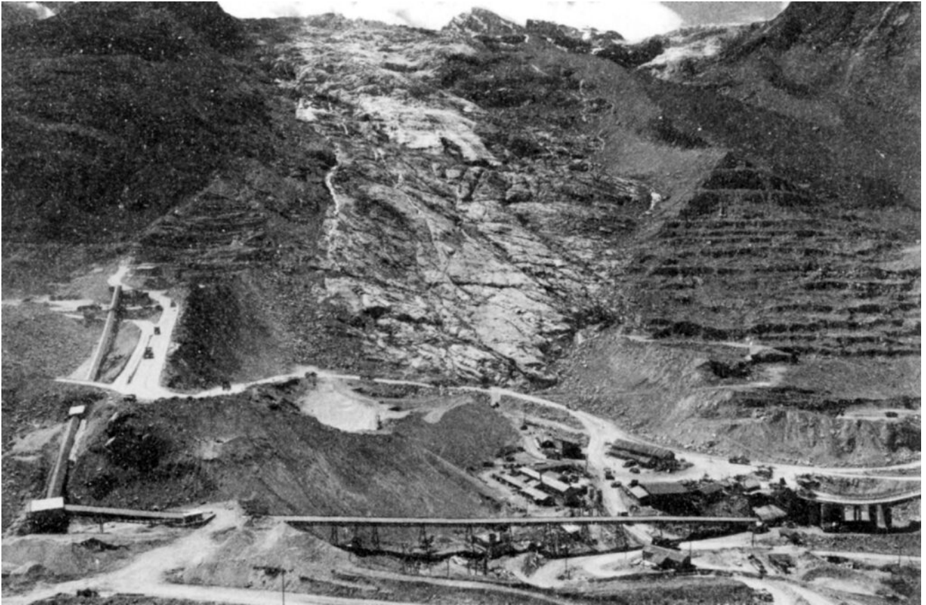
Foto links:Baustelle Mattmark mit Unerkünften unterhalb des Gletschers, Juli 1965. In: Toni Ricciardi, Morire a Mattmark. L'ultima tragedia dell'emigrazione italiana, Roma, 2015.